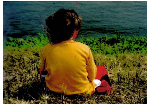
Raum für Ruhephasen