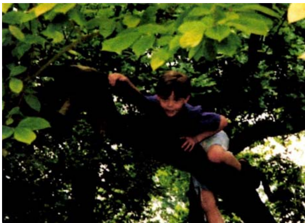
Raum geben zum Bewegen u.a. um motorischen Fähigkeiten zu stärken